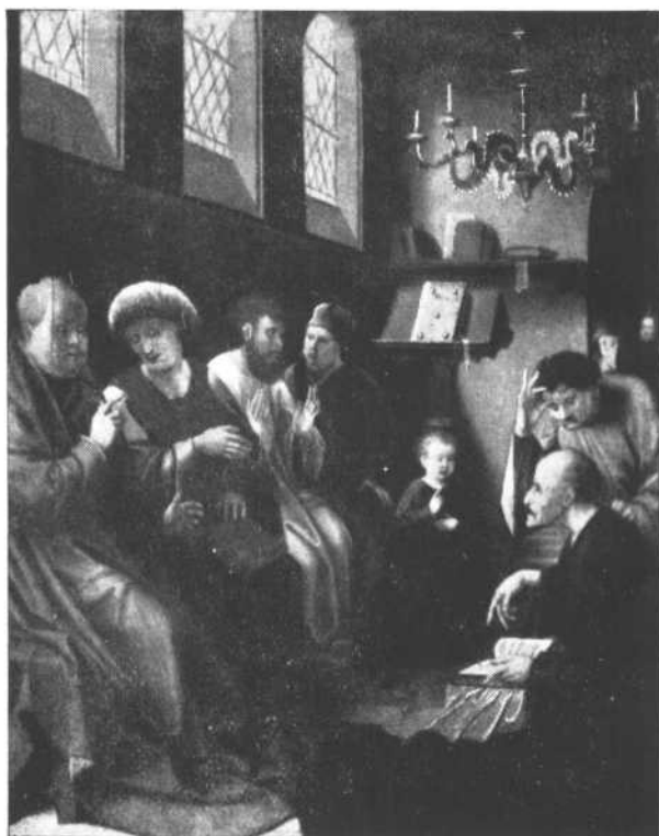
JESÚS entre los Doctores