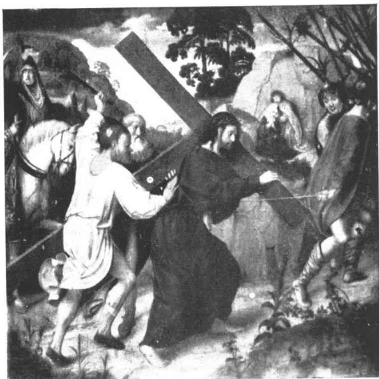
CRUZ a cuestas