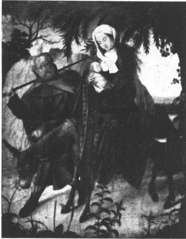
HUÍDA a Egipto