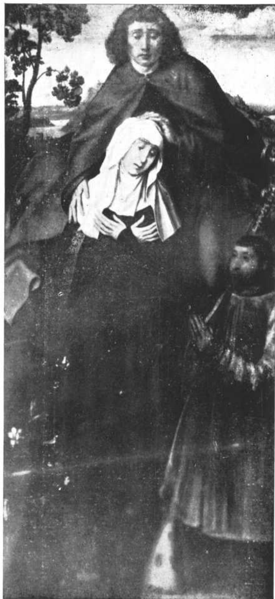
LA SANTÍSIMA VIRGEN, sostenida por San Juan.